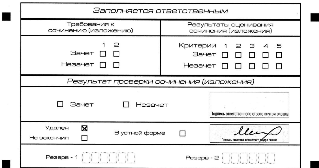
Рис. 13. Заполнение полей нижней части бланка регистрации (удаление с экзамена)

В случае если участник итогового сочинения (изложения) нарушил установленные требования, изложенные в пункте 28 Порядка проведения государственной итоговой аттестации по образовательным программам среднего общего образования (приказ Минпросвещения России и Рособрнанадзора от 4 апреля 2023 г. № 232/551), он удаляется с итогового сочинения (изложения). Член комиссии по проведению итогового сочинения (изложения) составляет «Акт об удалении участника итогового сочинения (изложения)» (форма ИС-09), вносит соответствующую отметку в форму ИС-05 «Ведомость проведения итогового сочинения (изложения) в учебном кабинете ОО (месте проведения)» (участник итогового сочинения (изложения) должен поставить свою подпись в указанной форме). В бланке регистрации указанного участника итогового сочинения (изложения) необходимо внести отметку «X» в поле «Удален». Внесение отметки в поле «Удален» подтверждается подписью члена комиссии по проведению итогового сочинения (изложения) (см. рис. 13).